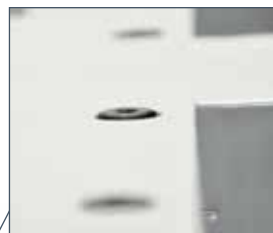
Öka friktionen maximalt genom att montera Anti-slip insatser av gummi.