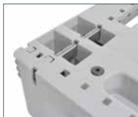
Förstärkningar: Stålprofiler anpassade för både lång och kortsida