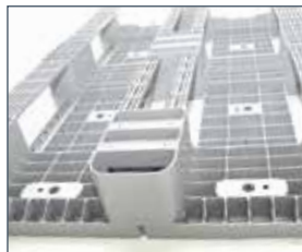
Anti-slip insatser ger optimal friktion mot t.ex truckgafflar