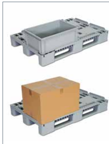
Alla typer av backar och lådor kan lastas till full längd och bredd 1200x800mm. Stödkanten inkräktar inte på lastmått