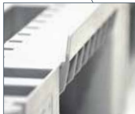
1200x800mm lastyta med stödkant utanför de angivna måtten.